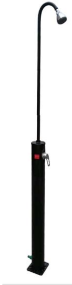
SF AURINKOSUIHKU 10L SÄILIÖ MUSTA