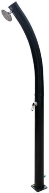
SF AURINKOSUIHKU 20L SÄILIÖ MUSTA